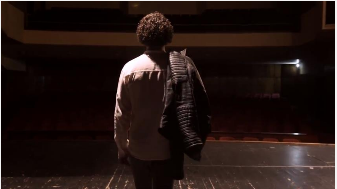
Spot "Conferenza dei consoli italiani nel mondo"

Link: https://www.youtube.com/watch?v=iLH57YCtZ2g