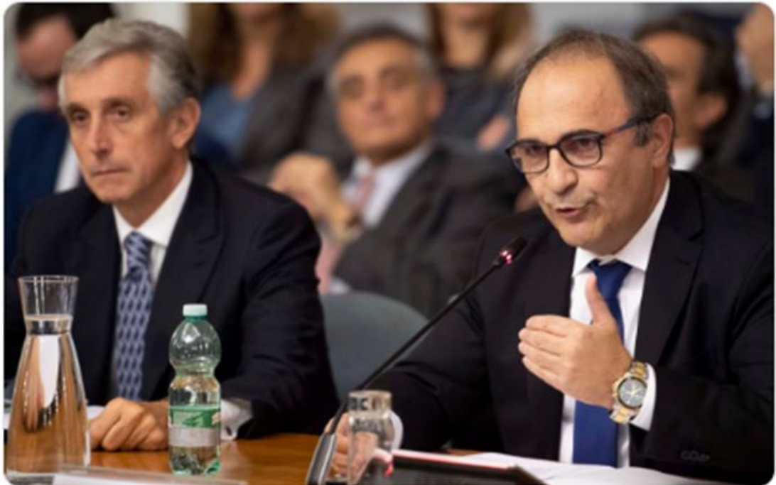
Luigi Maria Vignali

#ConfConsoli | Sottosegretario @RicardoMerlo5 apre i lavori alla #Farnesina: "La sfida dei nostri Consoli è assicurare ai cittadini italiani all'estero servizi di qualità e la dovuta attenzione in un contesto di risorse diminuite".