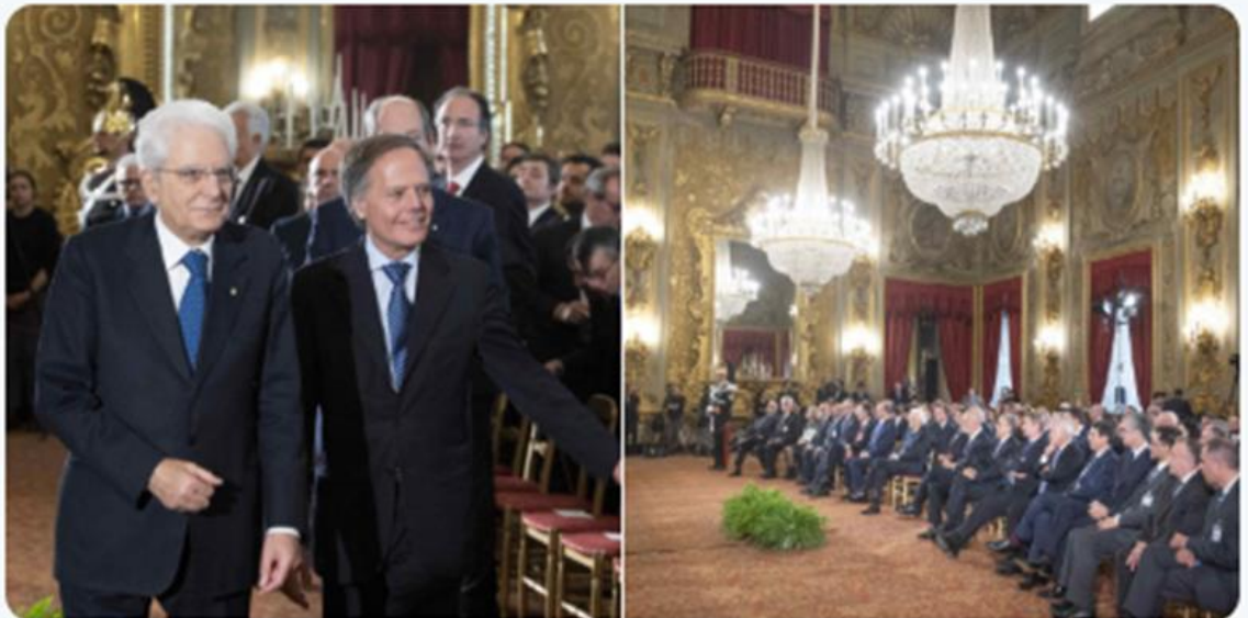
Quirinale e Luigi Maria Vignali